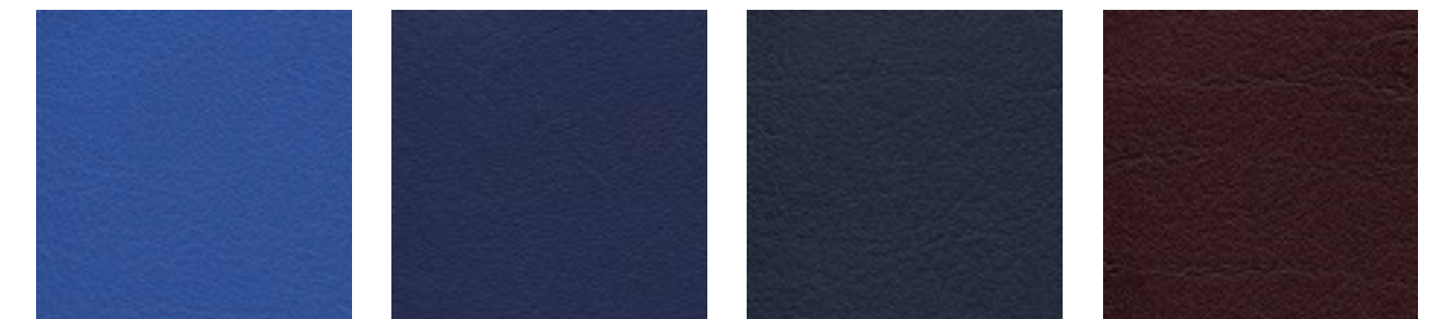
atoll F6461453 royal F6461196 ocean F6461204 bordeaux F6461350