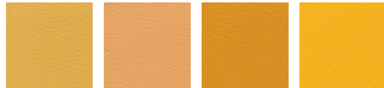
mais F6461457 apricot F6461458 mango F6461607 safran F6461542