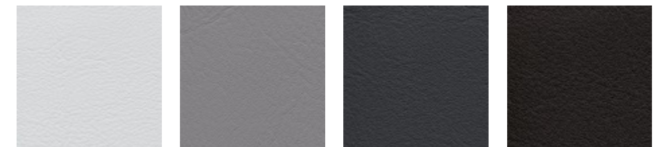
perle F6461288 chrom F6461205 anthrazit F6461197 schoko F6461357