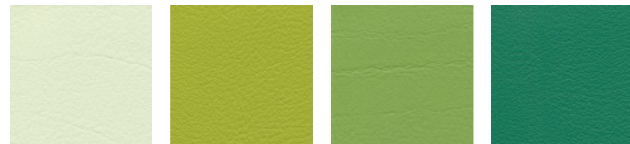
pistazio F6461610 limone F6461543 apfelgrün F6461723 smaragd F6461455