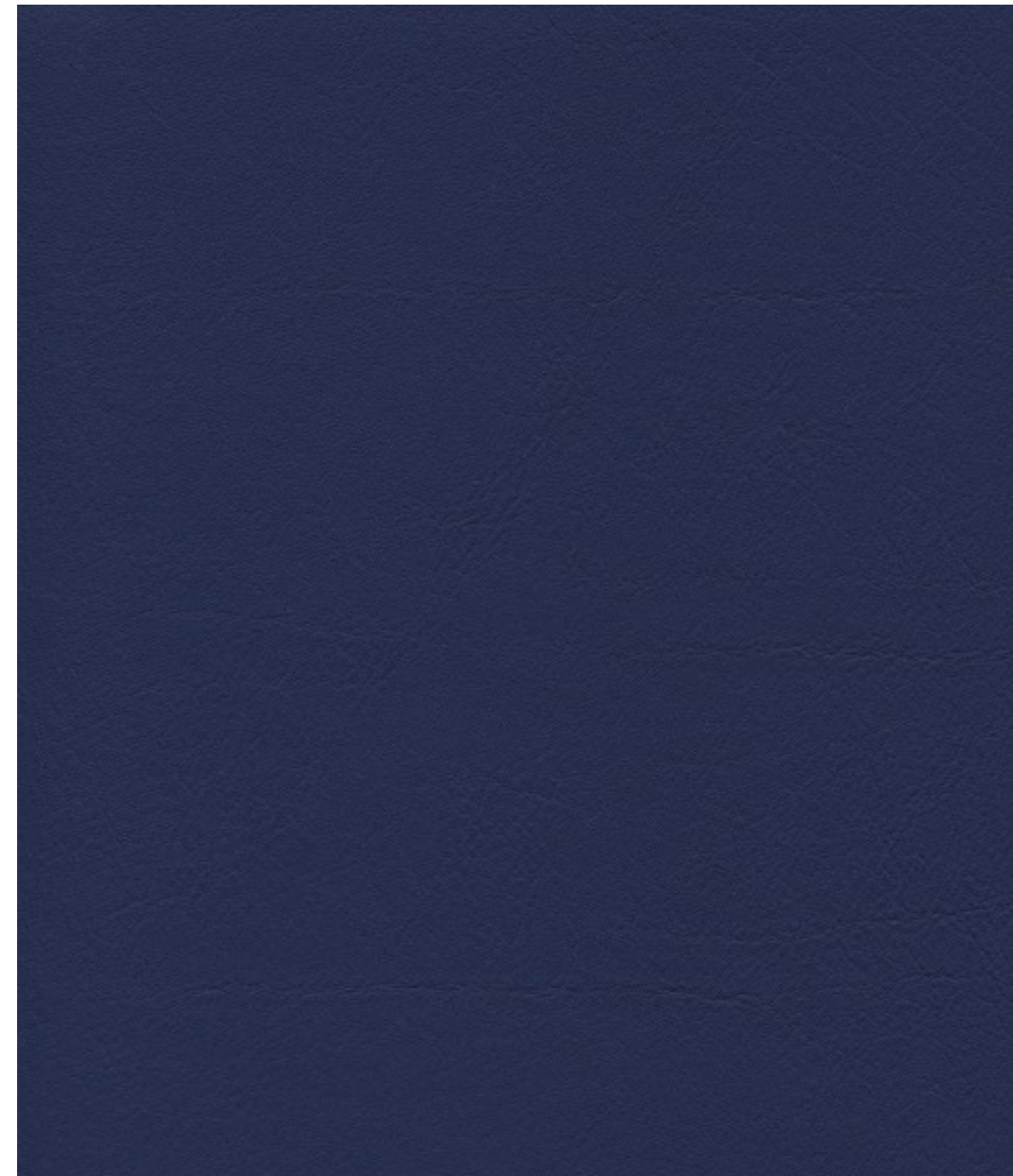
skai® Tundra royal F6461196

Un material skai® de alta calidad con el grano fino del cuero vacuno y un sutil efecto mate-brillo. Su amplísima gama de colores hace posibles numerosas posibilidades de aplicación y combinación.