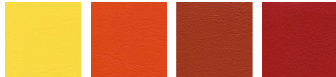
limonade F6461343 orange F6461556 karneol F6461557 feuer F6461454