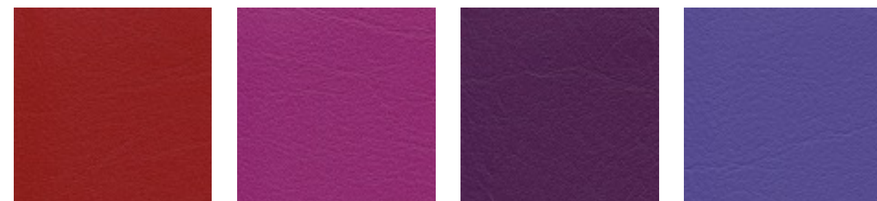
kirsche F6461199 cyclame F6461381 orchidee F6461354 violett F6461356