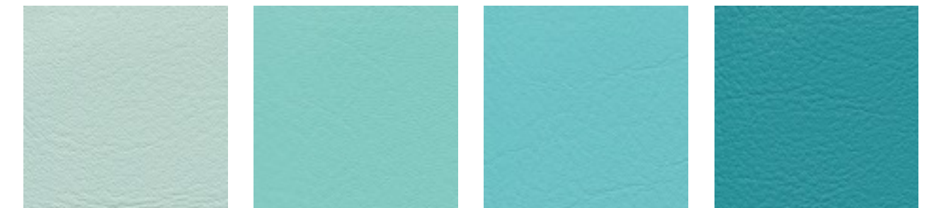
mint F6461495 aqua F6461456 türkis F6461338 agave F6461273