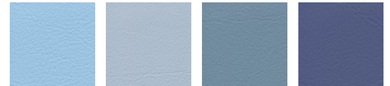
dolphin F6461609 stone F6461608 bleu F6461496 sky F6461581